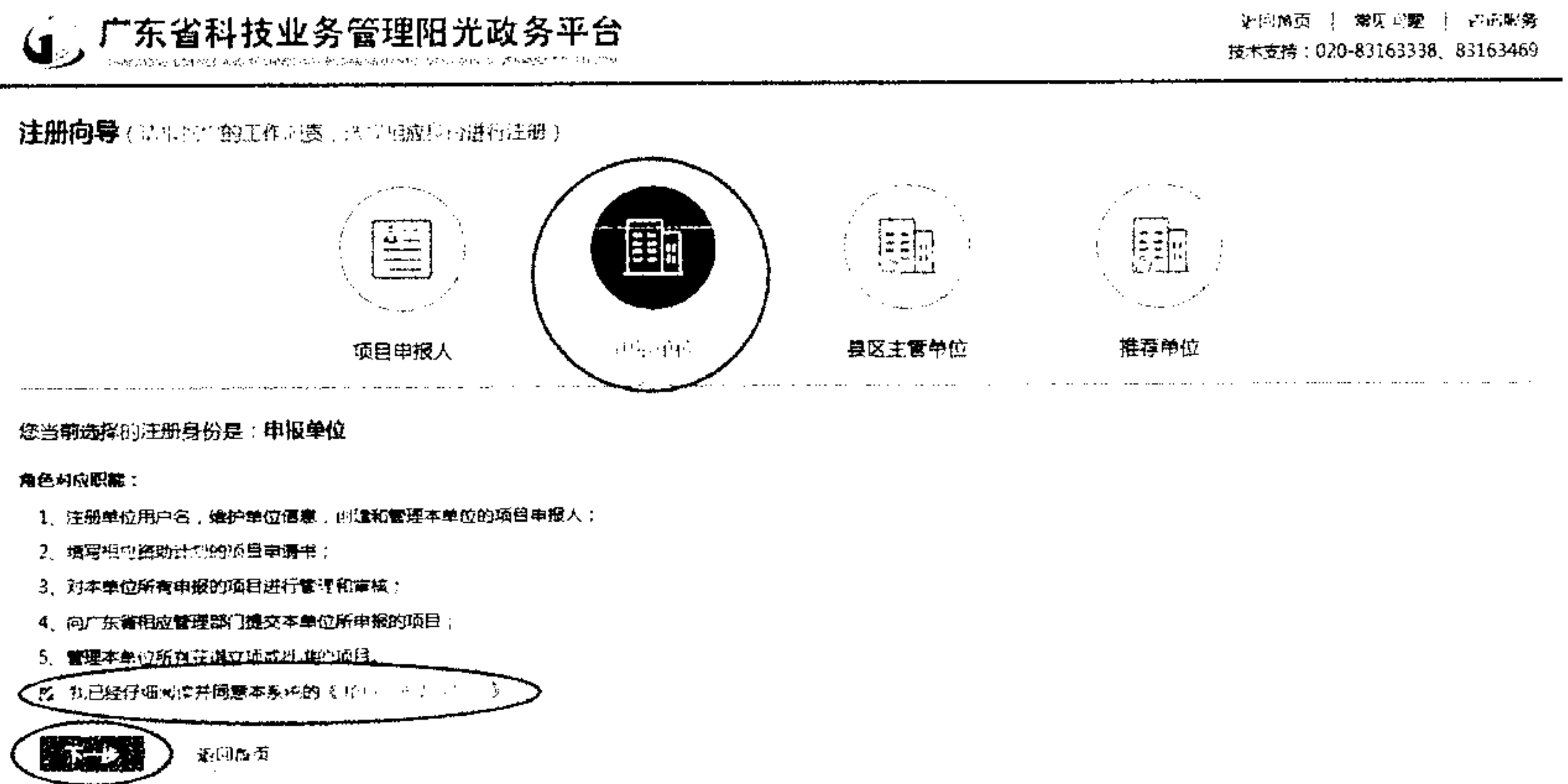
图2 以“申报单位”角色开始注册