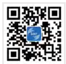
广州市科学技术局 官网