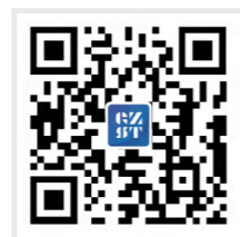
2023 广州市科技政策 服务手册