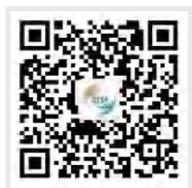
广州科技创新 微信公众号