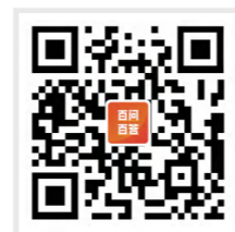
2023 广州科技政策 百问百答手册