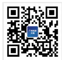
广州科技大脑 官网